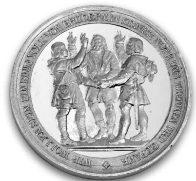
Einer für alle, alle für einen