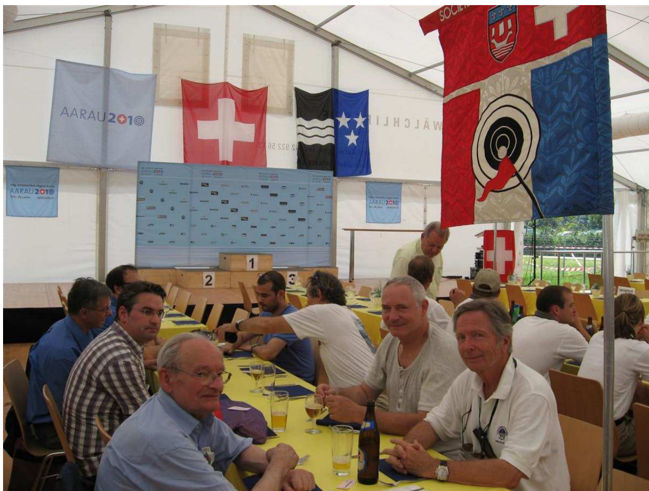
Aarau en 2010