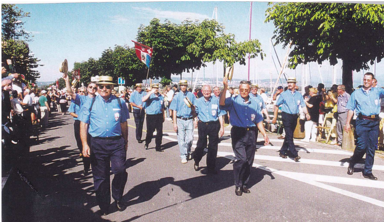
Bière en 2000

La Société Suisse de Tir de Paris participe toujours aux tirs cantonaux et fédéraux