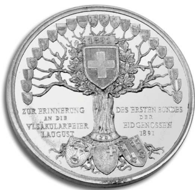
Médaille en aluminium des tireurs suisses de Paris 600 ans de la Confédération 1891

N'hésitez pas à consulter également le site http://sstp.suissemagazine.com