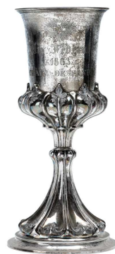
Prix obtenu au Tir fédéral de 1863 à la Chaux-de-Fonds